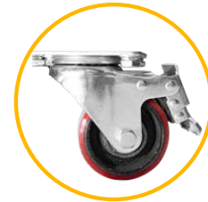
Ruedas traseras giratorias con sistema de freno