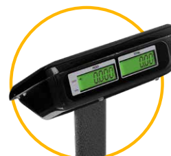
Pantallas posteriores para vista al cliente