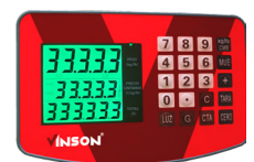
Carcasa frontal de plástico ABS

SERVICIO Y REFACCIONES DISPONIBLES Contamos con una red de centros de servicio en toda la república: rhino.mx/servicio.html