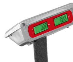
Indicador posterior de acero inoxidable